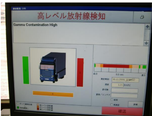
検知結果「高レベル放射線検知」