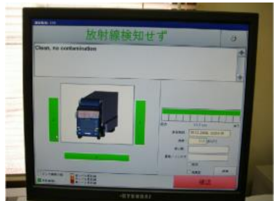
検知結果「放射線検知せず」